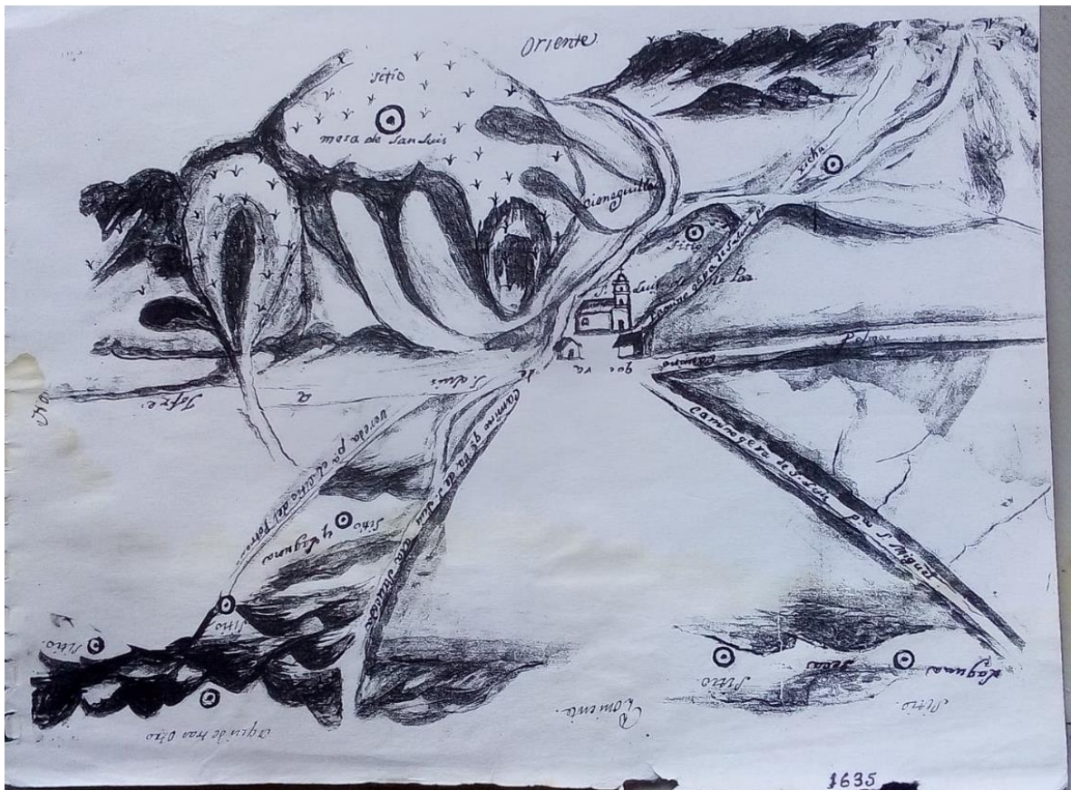
Mapa 1a. Año de 1635. Croquis de la región alrededor de la Congregación de San Luis de la Paz, entre elevaciones orográficas, cuerpos de agua, y caminos, con indicación de rumbos; “Nor”(te) a la izquierda, Sur” a la derecha, “oriente” arriba, “poniente” debajo, al parecer elaborado para petición de “sitios” que se indican con punto inscrito en círculo.

Casi al centro tres edificios, dos pequeños al lado de caminos y el mayor, la iglesia que da ubicación “ San Luis de la Paz ”, entre ésta y una vivienda, “ camino que va de San Luis para Xichú ” (rumbo suroriente): detrás de la iglesia otro camino que pasa junto a “ Cieneguilla ”, del oriente sigue a unirse al “ camino de San Luis a la Saucedá ”; casi paralelo a éste, “ vereda para el sitio del potrero ” rumbo norponiente con representación de macizo serrano, y entre este camino y vereda, “ laguna y sitio ”, antes de las estribaciones del conglomerado, cerros o sierra, del otro lado en rumbo surponiente, entre dos sitios